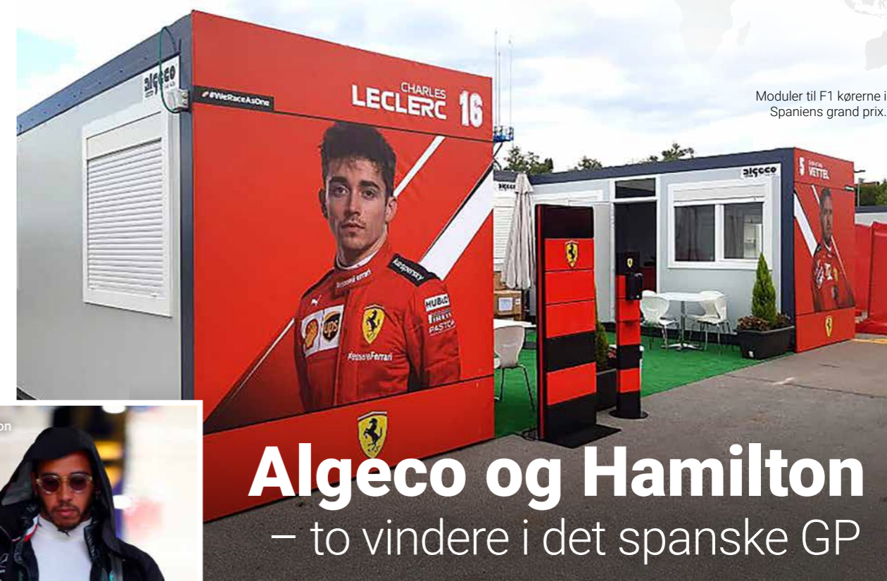
Moduler til F1 køerne i Spaniens grand prix.

Algeco er repræsenteret i store dele af verden. I hvert nummer af Algeco News bliver der zoomet ind på et land for at vise virksomhedens mange og spændende projekter. I dette nummer tager vi til Spanien.